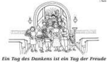
Ein Tag des Dankens ist ein Tag der Freude