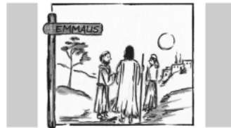
Ostermontag: Im Widerschein der Erlösung

09:30 Uhr Festmesse in Flachsmeer 1. Lesung: Apg 2,14.22-33 2. Lesung: 1 Kor 15,1-8.11 Evangelium: Lk 14,13-35