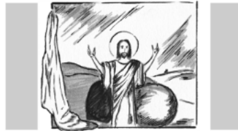
Ostersonntag: Im Glanz der Auferstehung

09:30 Uhr Familiengottesdienst 1. Lesung: Apg 10,34a.37-41 2. Lesung: 1 Kor 5,6b-8 Evangelium: Joh 20,1-9